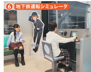
6 地下鉄運転シミュレータ 地下鉄台原駅～旭ヶ丘駅間を運転します。モニターには実写映像が映し出されます。