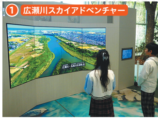
1 広瀬川スカイアドベンチャー 広瀬川の downstream から上流に向かって撮影した躍動感のある映像を楽しめます。