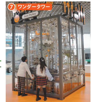
7 ワンダータワー 約3mの高さがある巨大なメカニカルタワーです。ハンドルを回して、ギア(歯車)やリンク(棒や板)などを操作し、ボールを運びます。