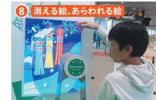
8 消える絵、あらわれる絵 偏光板と呼ばれる特殊な板を通して絵を見ると、角度によって別の絵になったり色が変わったりします。