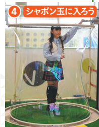
4 シャボン玉に入ろう 大きなシャボン玉の中に入ることができます。