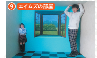
9 エイムズの部屋 目の錯覚を利用して、人が大きく見えたり小さく見えたりする不思議な部屋です。