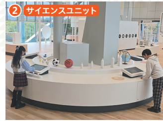
2 サイエンスユニット 科学で使われる長さや重さ、時間などの要素を楽しく体験できます。