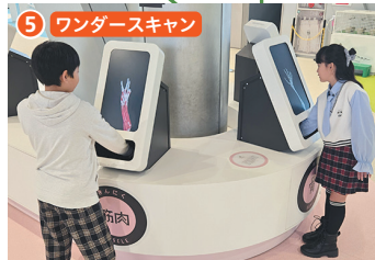
5 ワンダースキャン 自分の手の血管や骨、筋肉などを疑似的に観察でき、動物の手にも変化します。