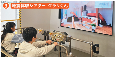
3 地震体験シアター グラリくん 東北地方太平洋沖地震や岩手・宮城内陸地震などの揺れを体験できます。モニターでは、物が崩れ落ちる様子が映し出されます。 ※身長120cm以下の方などはご利用できません。