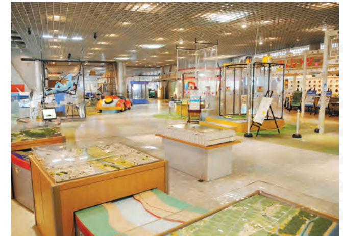
くらしの中の科学をいろいろな面から体験、体感できる展示物が盛りだくさん!