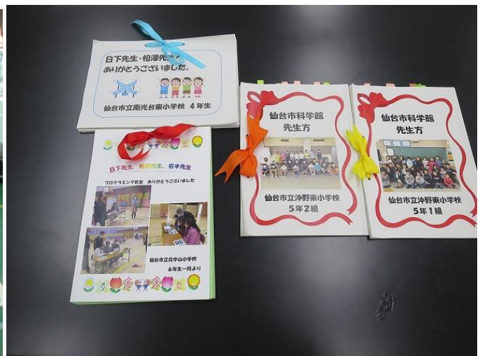
ドローン教室後に送られてきた感謝の手紙