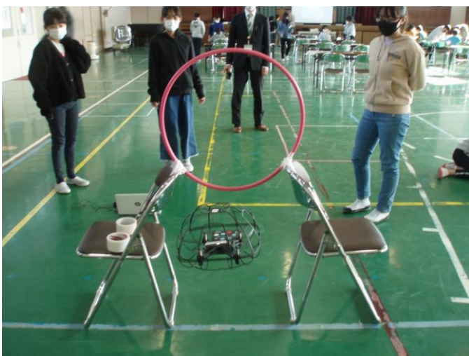
プログラミングで輪くぐり成功