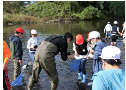
七北田川中流での調査