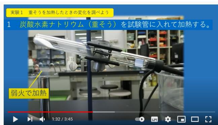
中学生向け学習動画 中学2年 化学変化と原子分子