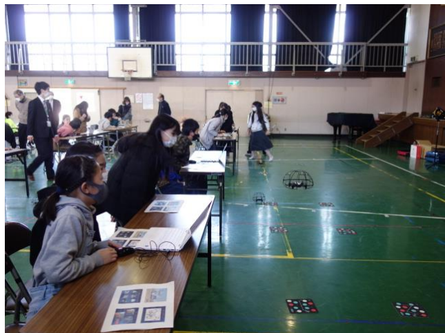
ドローンが離陸したところ