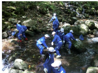
泉ヶ岳ヒザ川での調査