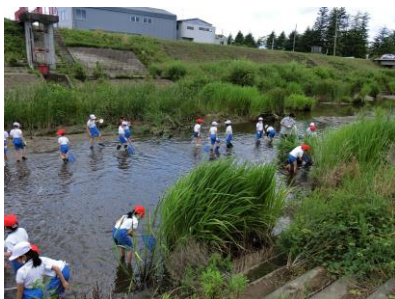
名取川中流での調査