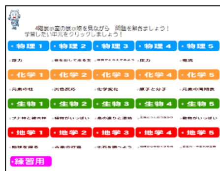
【タブレット端末のホーム画面】

「展示学習」は、本館4階の展示物を見たり、操作したりすることを通して各分野の課題（10問程度の問題から構成）に取り組む学習である。平成31年度よりタブレット端末を導入し、これまで活用していたマークシート方式の課題シート（20種）を端末内に移行した。生徒はそれぞれこの端末を持って、興味のある課題を選択して学習する。端末上で回答後、端末上で正誤を判定することができる。おおよそ90分間の学習時間で3つの課題を終えることを推奨している。