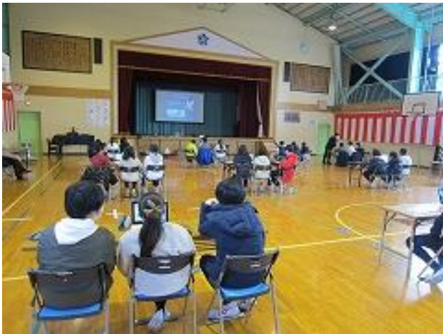
ドローン教室のようす

コロナ禍で学校行事や施設見学などができなくなっている状況で、アウトリーチによるドローン教室は、要望が多く歓迎された。開催後は、子供たち一人一人から感謝の手紙をもらった。ドローン教室のようすは、学校のホームページ（ブログ）や学校便りなどで紹介されている。