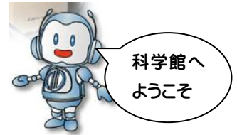
科学館キャラクター「だてまる」

スリーエム仙台市科学館 3M Sendai City Science Museum