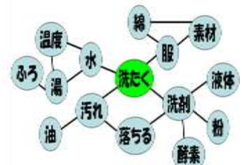
【 図1 ウェビング法の例 】

研究で明らかにしたいことが整理されるので、自分の力で解決できそうなことをねらいにしよう。