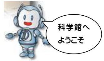
科学館キャラクター「だてまる」