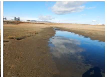
Fig.6 Fig.1○部 (R6.12.18)

調査日 2025年2月28日 (金) 13:00～14:15 ※干潮時刻10:01 (潮位58cm) 満潮時刻16:31 (潮位147cm)