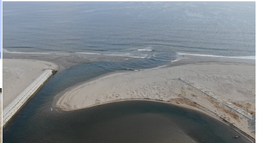
Fig.3 七北田川河口 (西側からドローン撮影)