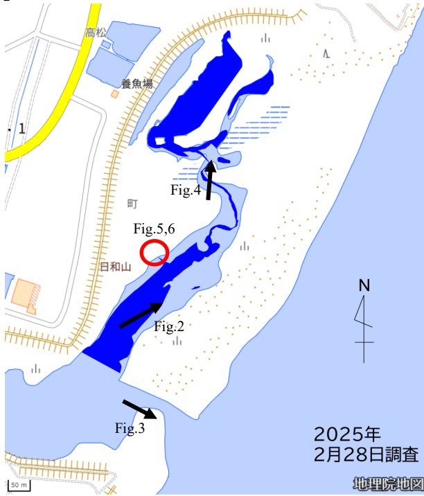
Fig.1 GPS簡易測量結果 (地理院地図を加工して作成)