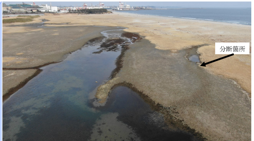
Fig.2 潟湖中央部～南東部の様子 (南側からドローン撮影)