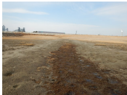
Fig.5 Fig.1○部 (R7.2.28)