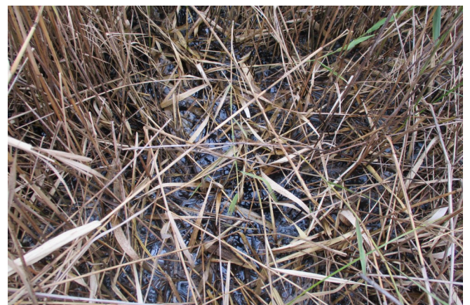
Fig.3 ヨシに覆われたSt.3付近の様子

調査日時：2024年10月23日（水）10:30~12:00（干潮 11:37 潮位 111cm），天気：くもり