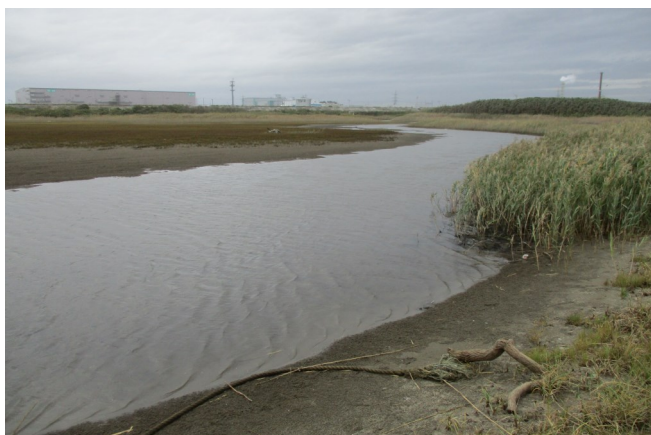
Fig.2 南側潟湖と北側潟湖の接続部分付近