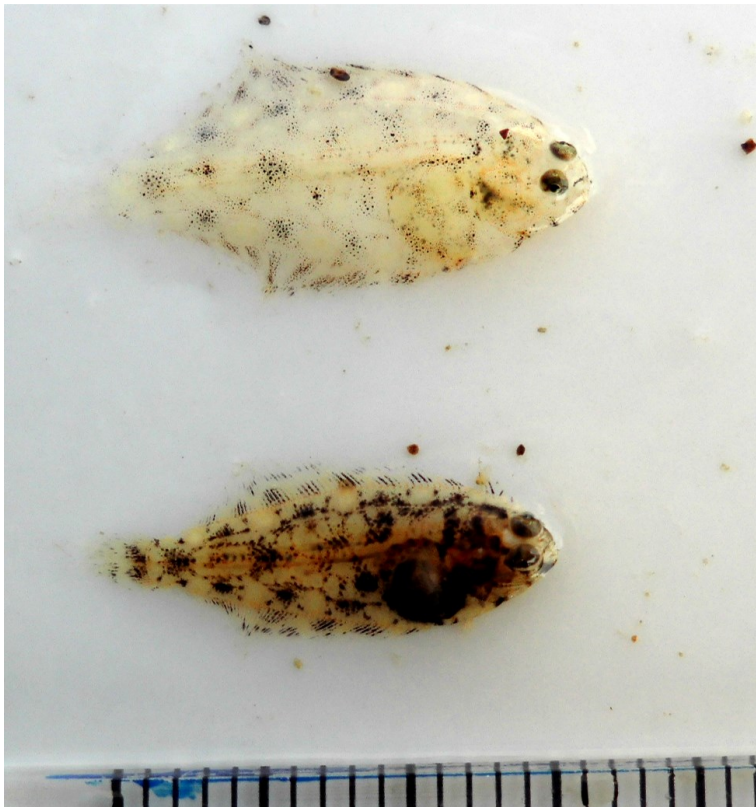
(Fig.2 河口で採集したイシガレイ) 色素の発達は、全長と必ずしも一致しない