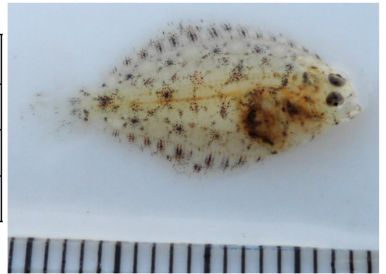
(Fig.1 水門付近で採集したイシガレイ)