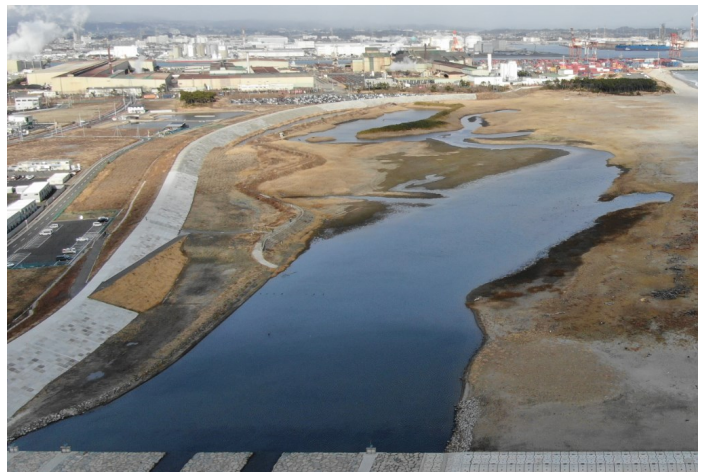
Fig.3 潟湖南部の様子(ドローンによる撮影)

調査日時：2022年1月14日（金）12:45~14:00，天気：晴れ，満潮時刻12:17（潮位131cm）