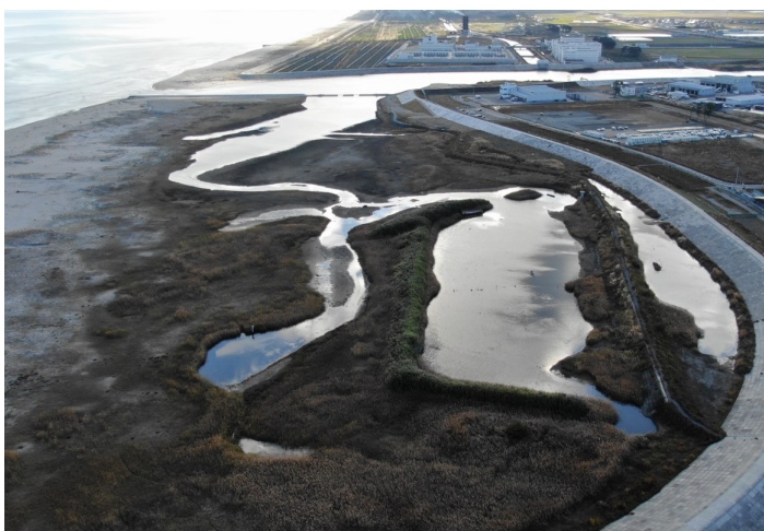
Fig.2 潟湖北部の様子(ドローンによる撮影)