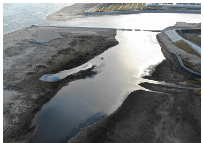
Fig.3 潟湖南部の様子(ドローンによる撮影)

調査日時：2021年11月17日（水）13:30~14:45，天気：晴れ，満潮時刻14:09（潮位144cm）