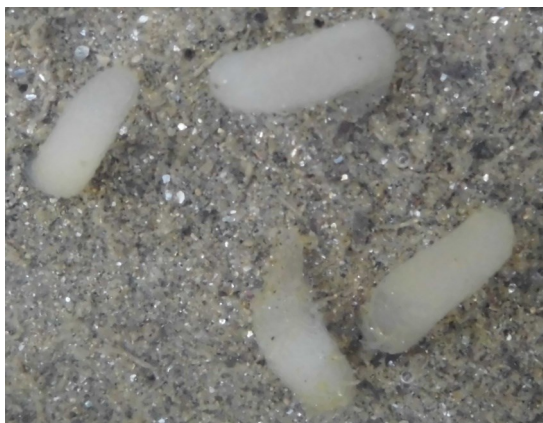
(Fig.3 ゴカイの仲間の卵 潟湖内)