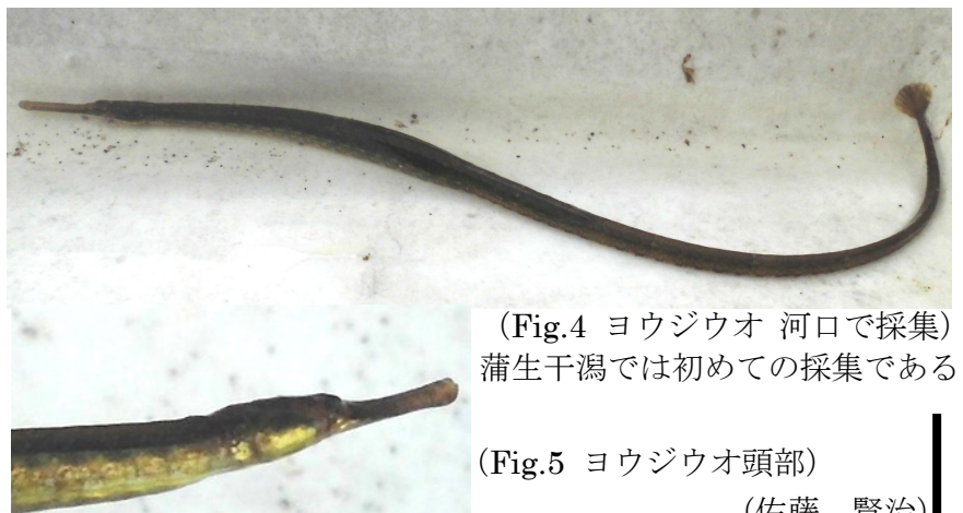
(Fig.4 ヨウジウオ 河口で採集) 蒲生干潟では初めての採集である