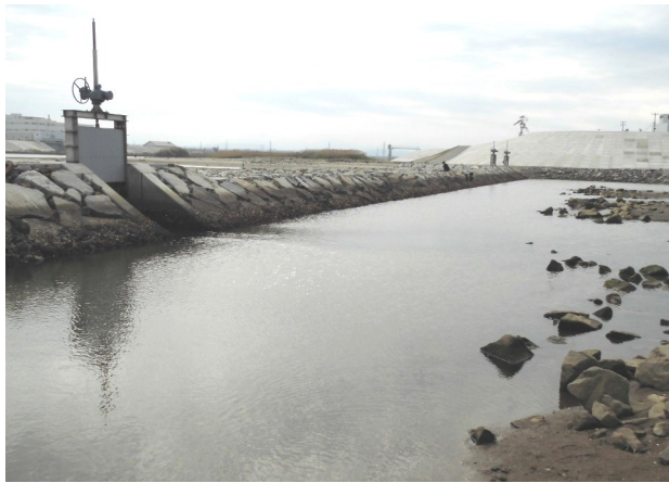
(Fig.1 潟湖内の砂地が存在する部分)