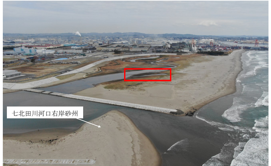
Fig.2 潟湖全体の様子（南東側からドローン撮影）