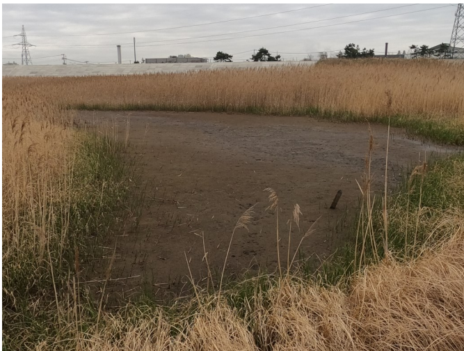
Fig.3 干上がった潟湖最北部（南側から撮影）