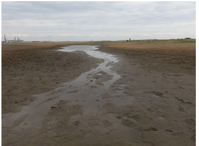
Fig.4 潟湖南東側の様子（南西側から撮影）

調査日 2021年4月16日（金）9:30～11:00 ※干潮時刻12:02（潮位11cm）