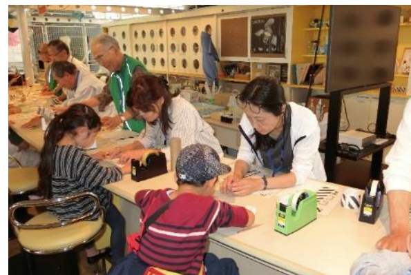
サイエンス・インタプリター養成講座とチャレンジラボの活動のようす