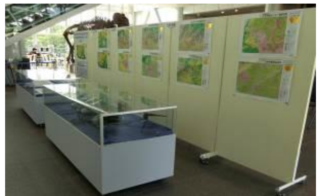
仙台市中学校生徒地図作品展入賞作品展示