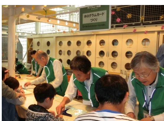
サイエンス・インタープリター養成講座と普段の活動のようす