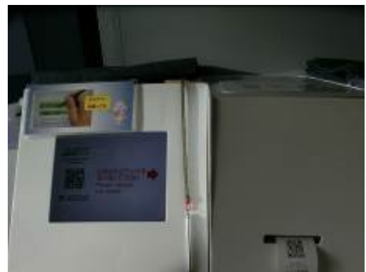
入力画面と QR コード