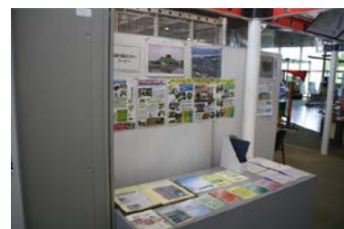
高砂市民センターコーナー