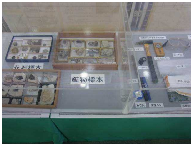
化石・鉱物標本製作見本，採集道具

内 容 過去の仙台市児童生徒理科作品展で市長賞や教育長賞をとった優秀な作品の展示を行った。また、自由研究や標本作りで使用する道具、それぞれの進め方、注意する点などを実物やパネルなどを通して紹介した。