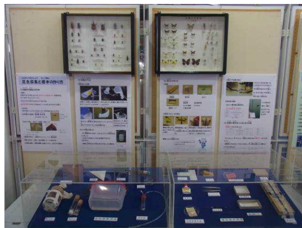
昆虫標本展翅見本，採集道具