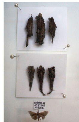
ミノガと幼虫(ミノムシ)