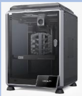
Creality K1C FDM 3Dプリンター